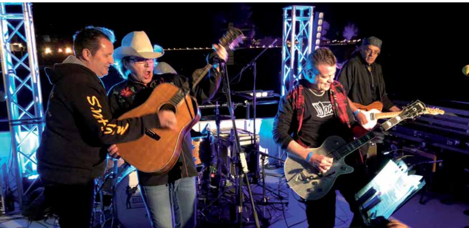
Themenfahrt, 3. SeeSound Cruise