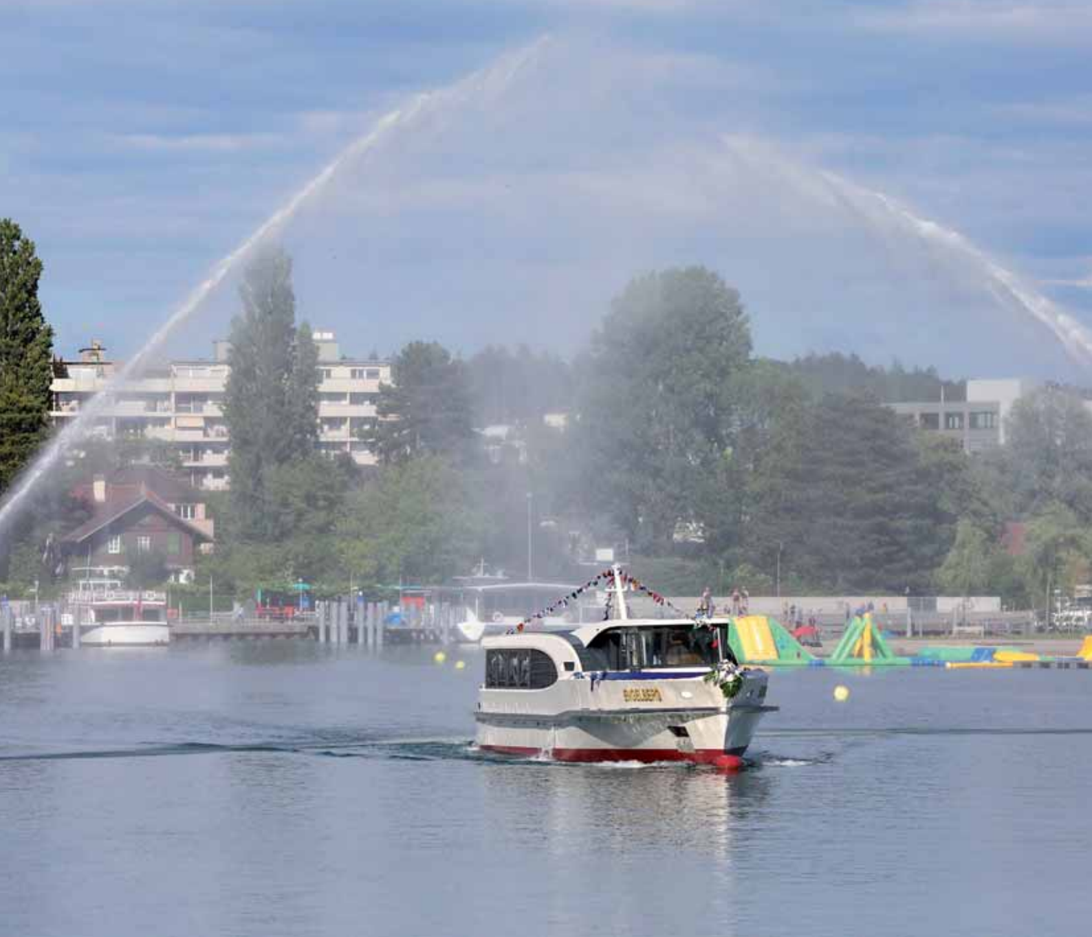
Schiffstaufe MS Engelberg