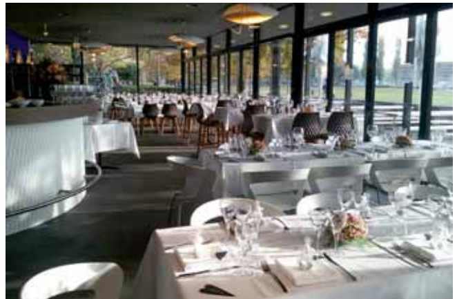
Hochzeit im Parc Café