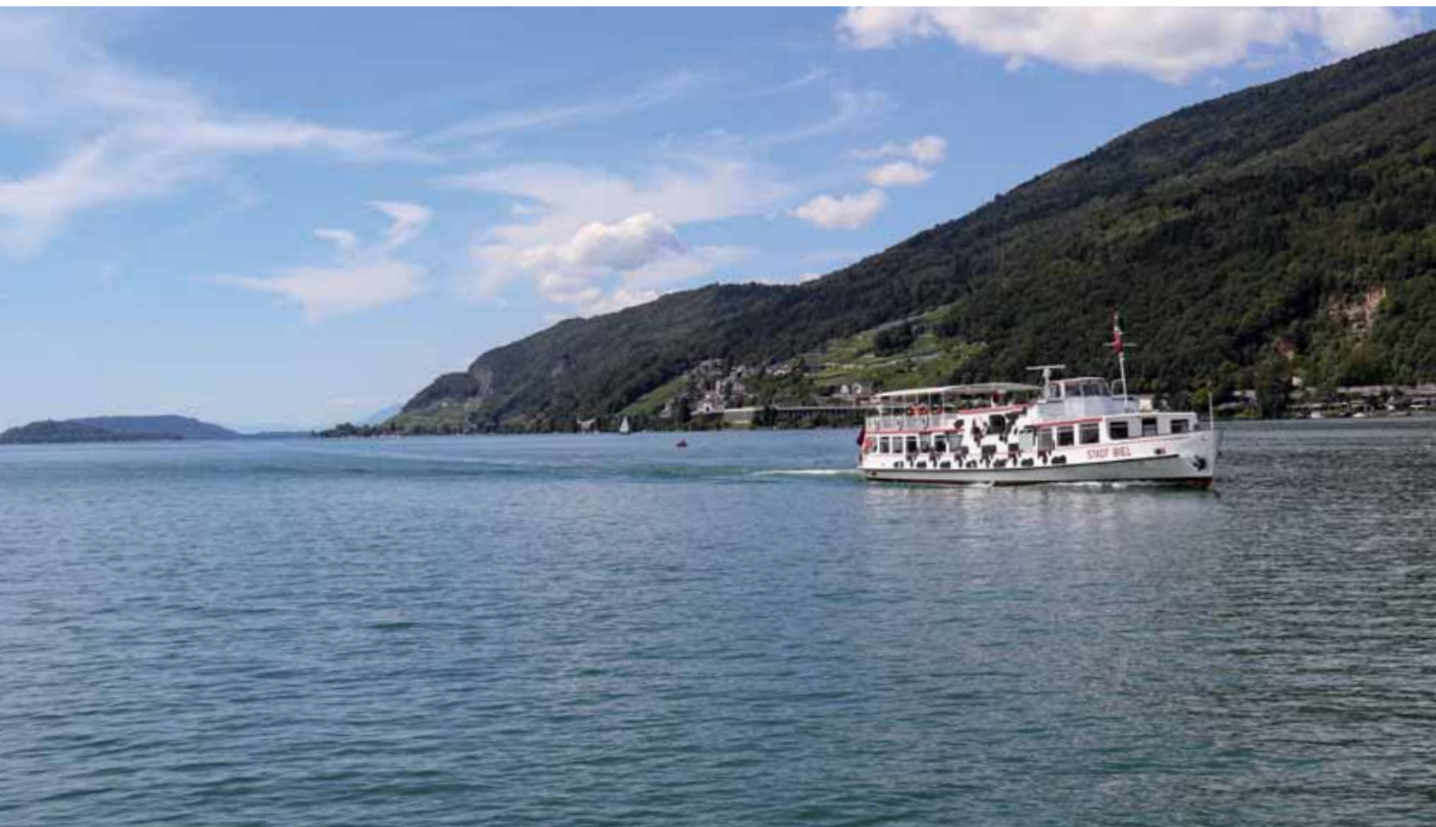
MS Stadt Biel, Bielerseerundfahrt

Die durch Verwaltungsrat und Geschäftsleitung festgelegte Wachstumsstrategie wird auch in Zukunft konsequent weiterverfolgt und umgesetzt.