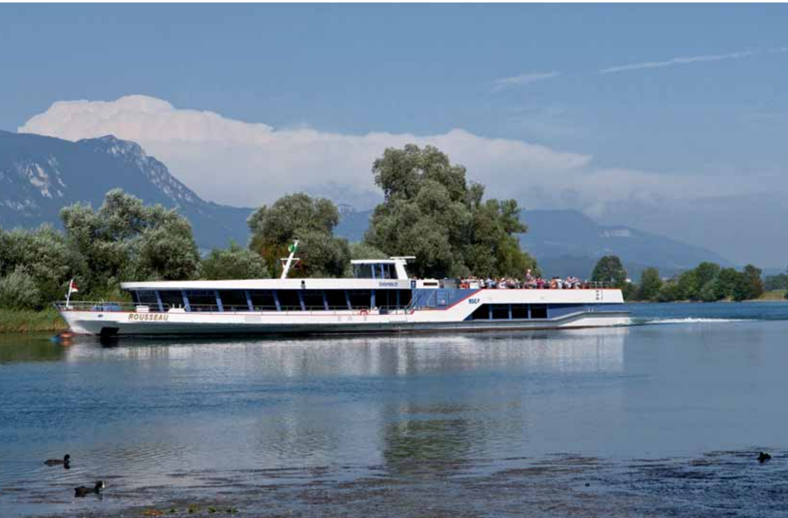
MS Rousseau vor Altreu