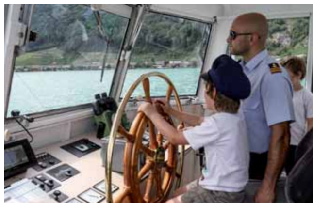
Kindern das Kommando

Zwei zukunftsweisende digitale Projekte fanden im Berichtsjahr ihren Abschluss. Kunden auf dem Bieler-, Neuenburger- und Murtensee erfahren auf einer App Näheres zu Sehenswürdigkeiten der Region. In Wort, Bild und Ton werden Informationen zur aktuellen und historischen Vielfalt des Drei-Seen-Landes wiedergegeben. Auch der Fahrplan des gesamten Streckennetzes der BSG ist seit September 2018 auf www.bielersee.ch digital abrufbar. Im 2019 folgt der neue Internetauftritt mit einem Ausbau von digital erhältlichen Informationen – einem wachsenden Kundenbedürfnis unserer Zeit.