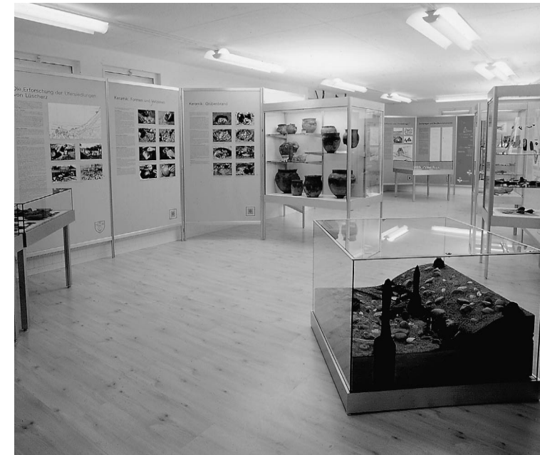
Blick ins Pfahlbaumuseum Lüscherz

Die Zeittafel fixiert einige kulturgeschichtlich wichtige Daten unserer Region im Vergleich mit den Kulturen des Mittelmeerraumes.